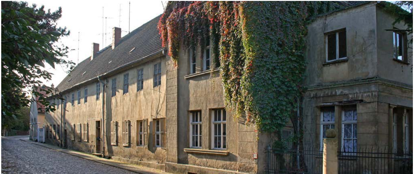
Bald Anlaufpunkt für alle Gäste des Gartenreichs Dessau-Wörlitz: Das Gelbe Haus in Wörlitz