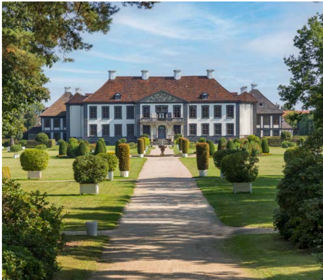
Das Parterre von Schlosspark Oranienbaum zieren in den Sommermonaten über 300 Zitruspflanzen.