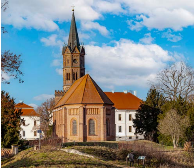
Das historische Ensemble aus Schloss Großkühnau und der Kirche am Kühnauer See