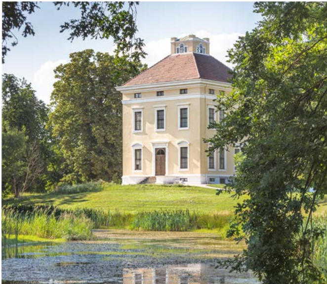
Erdmannsdorffentwarf das kleine Schloss in neopalladianischen Formen.

EIN PRIVATES REFUGIUM FÜR DIE FÜRSTIN LOUISE