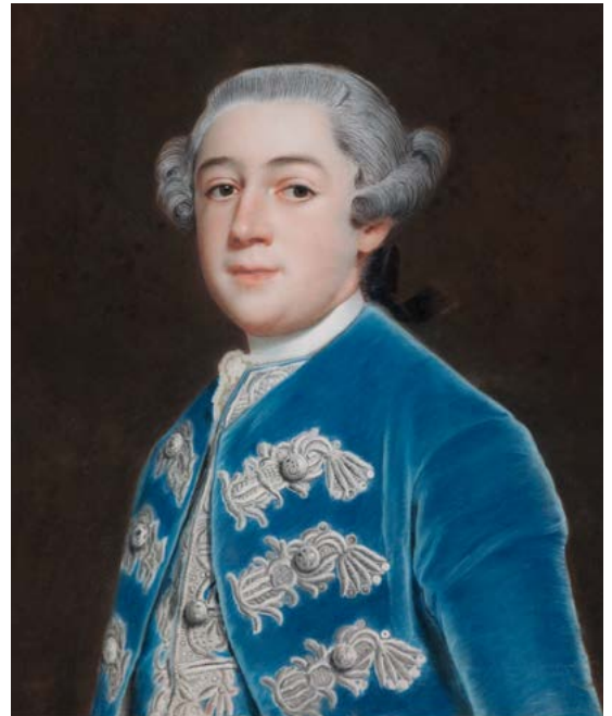
Porträt des jungen Fürsten Franz, der in seiner fast 60-jährigen Regierungszeit das heutige Gartenreich Dessau-Wörlitz gestalten ließ (C. F. R. Lisiewsky, um 1758, Pastell)