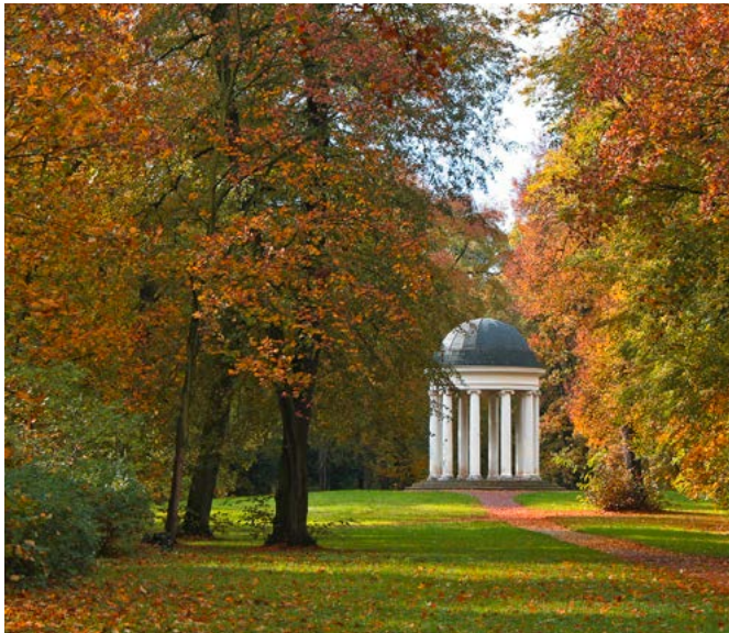
Ionischer Tempel (Monopteros) im Georgengarten

LANDSCHAFTSGARTEN UND KUNSTMUSEUM INMITTEN DESSAUS