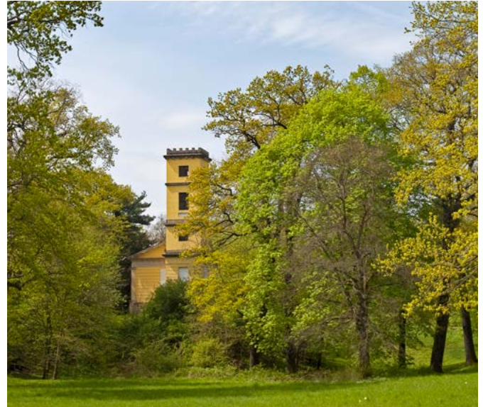
Das Weinberg-Schlösschen ist von Weitem sichtbar.