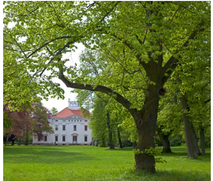
Im Schloss Georgium befindet sich heute die 1927 von Ludwig Grote (1893–1974) begründete Anhaltische Gemäldegalerie.