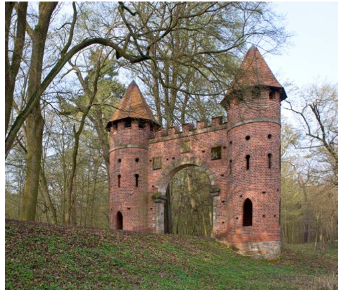
Einer von drei Eingängen in den Waldpark: das Burgtor