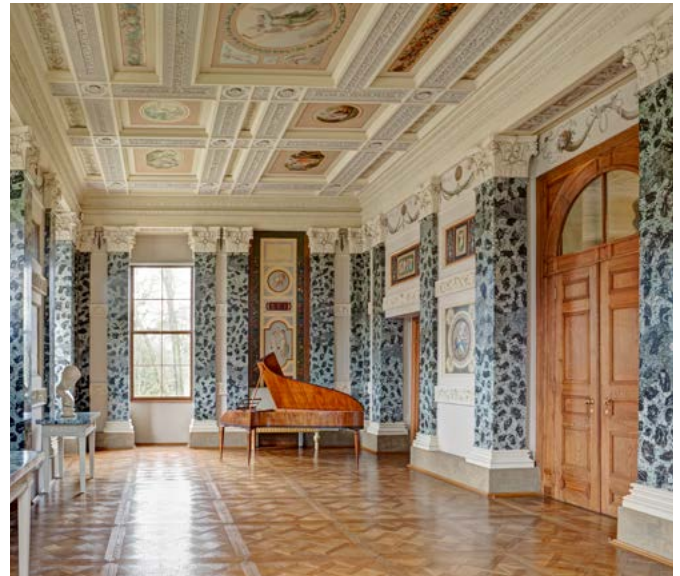
Die Wandmalereien des Festsaals zeigen typische Beschäftigungen einer Fürstin des 18. Jahrhunderts: Malerei, Dichtkunst, Lektüre und Musik.