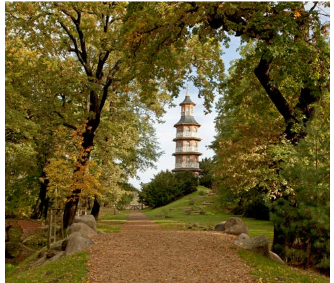
Die Pagode im chinesischn Stil ist Teil der Umgestaltung des Schlossparks durch den Fürsten Franz.