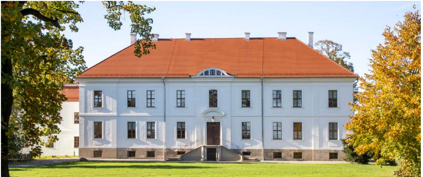
Das sanierte Schloss Großkühnau im Jahr 2021

Die Kulturstiftung Dessau-Wörlitz betreut mit dem Gartenreich Dessau-Wörlitz eines der bedeutendsten Flächendenkmale der Garten- und Landschaftsgestaltung Europas. Als »Hüterin« des Erbes von Fürst Franz ist es ihr Auftrag, die Schätze der Vergangenheit nachhaltig zu pflegen, zu erforschen und zu vermitteln. Neben den Schlössern und Sammlungen, den Schlossgärten und Parks und zahlreichen denkmalgeschützten Einzelbauwerken ist die Stiftung auch für ca. 7.100 Hektar Wald und landwirtschaftliche Flächen verantwortlich.