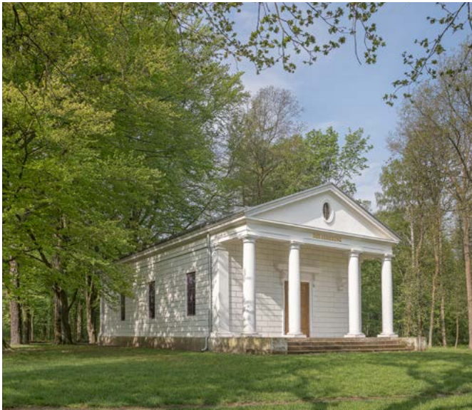
Die Solitude am Sieglitzer Berg ist von 2008 bis 2011 wiederhergestellt worden.