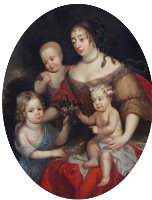
Henriette Catharina von Anhalt-Dessau mit Kindern (unbekannter holländischer Künstler, 1668, Öl auf Leinwand)

Henriette Catharina (1637–1708), Gemahlin des Fürsten Johann Georg II. von Anhalt-Dessau (1627–1693), ließ sich die großzügige Schlossanlage ab 1683 zunächst als Sommerresidenz errichten und ab 1693 als Witwensitz ausbauen und vergrößern. Die aus dem Haus Oranien-Nassau stammende Prinzessin gab dem Ort nicht nur einen auf ihre Familie bezogenen Namen, sondern verlieh dem Schloss auch das holländische Gepräge. Hierzu trug maßgeblich der aus der Heimat der Prinzessin stammende Baumeister Cornelis Ryckwaert bei.