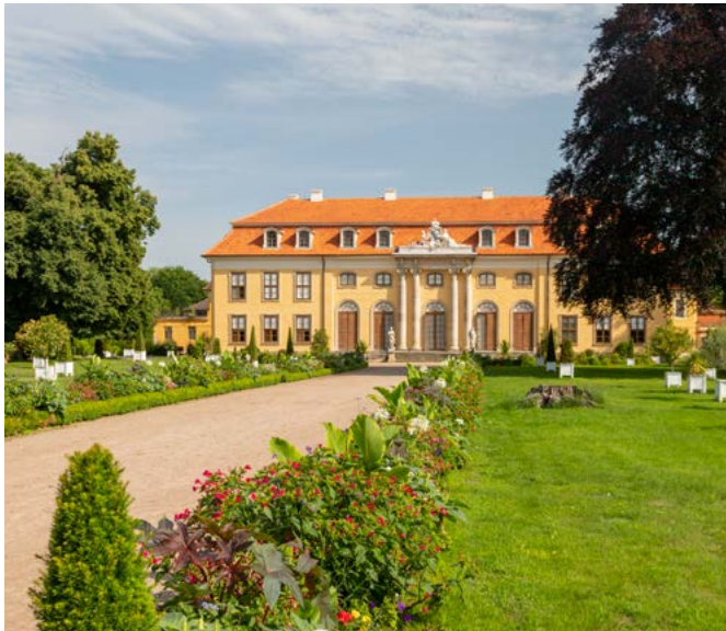
Das Rokoko-Ensemble von Schloss Mosigkau gilt auch als »Kleines Sanssouci«.