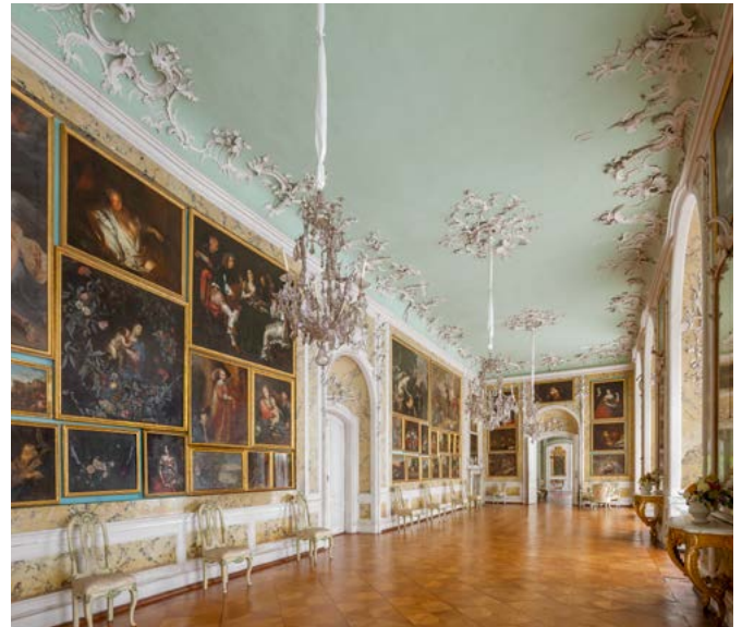
Der Galeriewand von Schloss Mosigkau birgt Kunstwerke großer Meister.